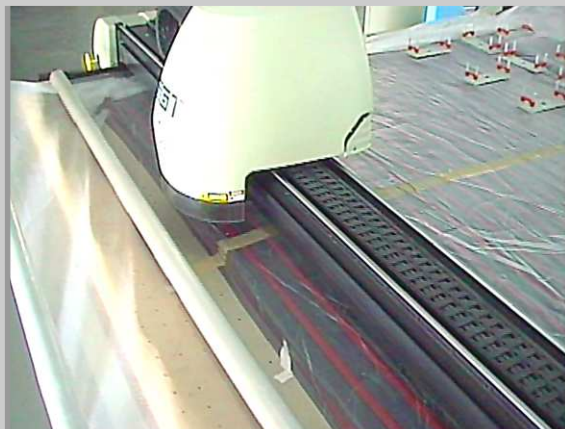
Zuschnitt von Ringelware mit einem CNC-Cutter