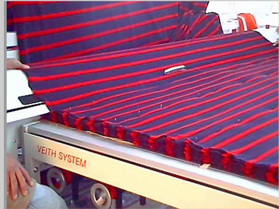
Abschneiden der Ware am Lagenanfang