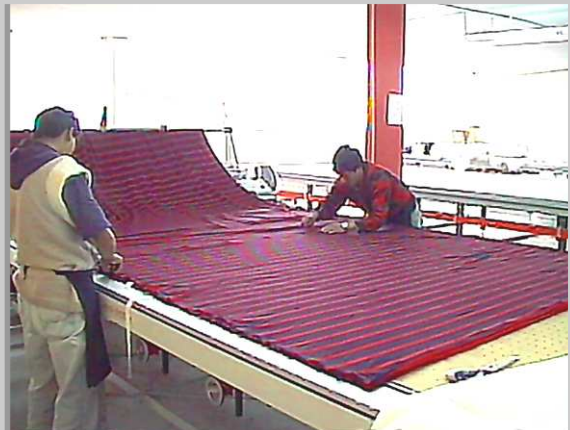
Legen der Ware entsprechend der Nadelpositionen

Hoch effizientes Legen und Abpassen von Wirkware - die integrierte Lösung von der Lagenbild-planung über das Legen bis hin zum Schneiden