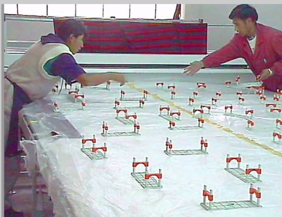
VEITH STOFFLAGENHALTER sichern das Lagenpaket für den Transport