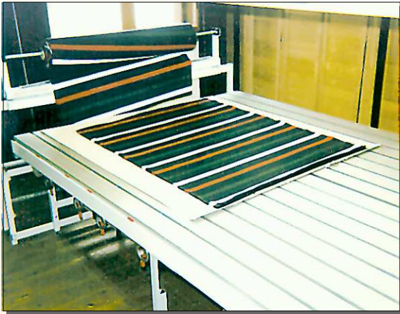
VEITH Nadeltisch mit Lage

☞ Top Qualität ☞ Stoffeinsparung ☞ höhere Produktivität ☞ Cutterzuschnitt möglich