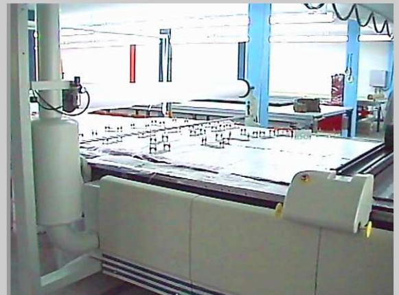
das Lagenpaket auf dem CNC-Cutter bereit zum Schneiden